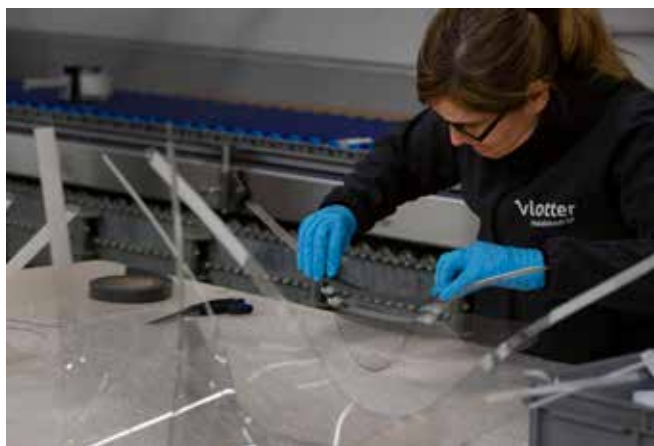
▲ De spatmaskers die Vlotter produceert zijn broodnodig voor de zorgverleners die dagelijks in de frontlinie staan.

Net zoals voor vele bedrijven is de uitbraak van het coronavirus voor Vlotter Maakbedrijf een economische tegenvaller. Bij het maatwerkbedrijf, dat zo’n 200 doelgroepmedewerkers een duurzame werkplek biedt, vielen sommige activiteiten grotendeels weg omdat er geen onderdelen meer geleverd konden worden vanuit het buitenland of klanten verminderde activiteit kenden. “Vlotter Maakbedrijf wist dat alles om te buigen naar een positief verhaal via een bijzonder samenwerkingsinitiatief dat in gang werd gezet door ‘MakersAgainstCorona’”, zegt Vlotter-voorzitter Bram Van Keer.