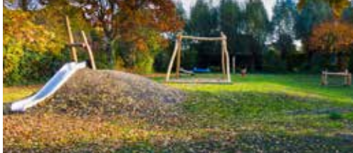
Speeltuin Jan Van Eycklei vernieuwd p.2