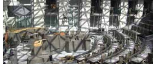
Bezoek mee het Vlaams Parlement p.3