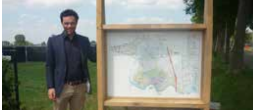
Nieuwe straatplanborden p. 2