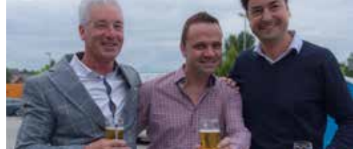
Kort genoteerd p. 3